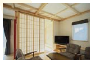
普段はオープンな和室。収納式の障子の仕切りでゲストルームに早変わり☆