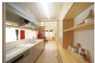
ワイドなゆったりキッチン♡