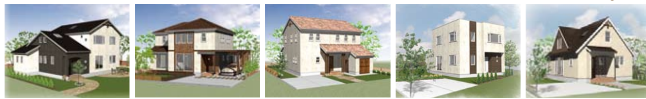
■三沢市岡三沢 ■おいらせ町青葉四丁目 ■十和田市三本木並木西 ■十和田市三本木西金崎 ■十和田市東二十一番町